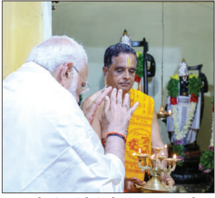
प्रधानमंत्री नरेंद्र मोदी ने श्री कोटंडारामा स्वामी मंदिर पहुंचे और पूजा-अर्चना की